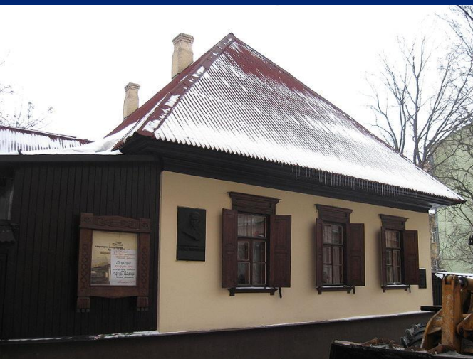
Літературно- меморіальний будинок- музей Тараса Шевченка