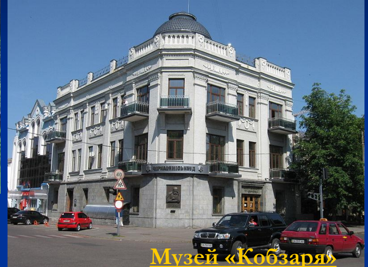
Музей «Кобзаря» Т. Г. Шевченка , м. Черкаси, єдиний у світі музей однієї книги