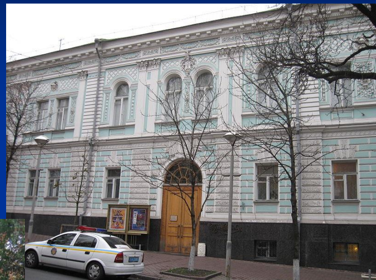
Національний музей Тараса Шевченка