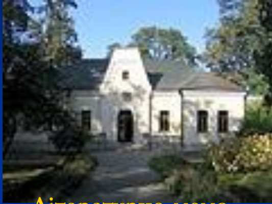
Літературно-меморіальний музей Тараса Шевченка , Черкаська обл., с. Шевченкове