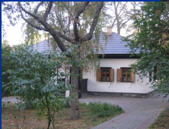
Хата на Пріорці