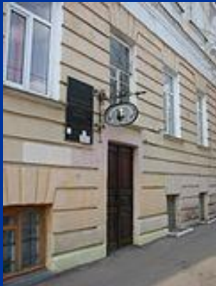
Меморіальний музей-гауптвахта Тараса Шевченка , м. Оренбург

Є також Орський музей Тараса Григоровича Шевченка , Музей Шевченка в Торонто , Меморіальний комплекс Т. Г. Шевченка в Форт Шевченко , Казахська державна художня галерея імені Т. Г. Шевченко